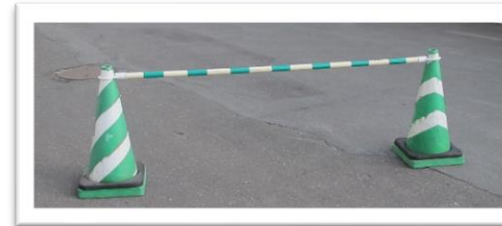
▲ 駐車コーン・ポール