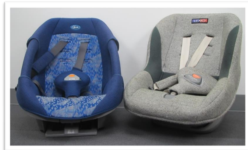
▲ チャイルドシート