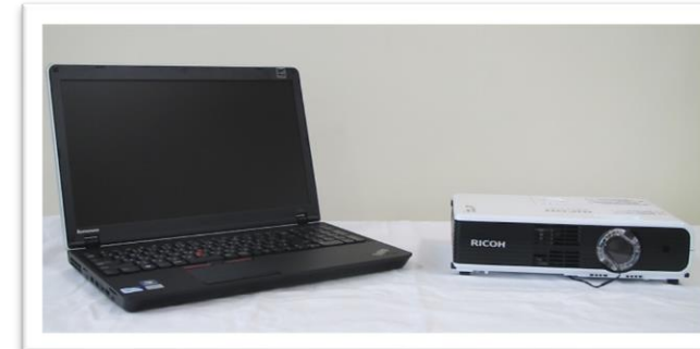
▲ ノートパソコン・プロジェクタ